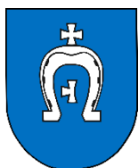
Miasto Międzyrzec Podlaski